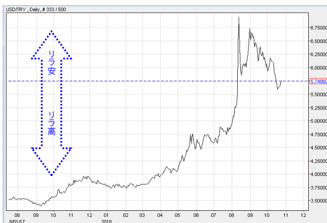
米ドル対トルコリラ

トルコの金地金・金貨需要は、経済の見通し悪化と通貨安の影響により落ち込みました。トルコリラ建て金価格が5月後半に過去最高を記録し、1グラム当たり202トルコリラに迫ったことで、需要は前年同期比で半減し、前四半期比で11%減少しました。ここ数四半期は、トルコ経済が力強い成長を見せていたこととリラの下落が懸念されていたことにより、金地金・金貨需要は比較的好調に推移していました。多くの投資家は、ここ1年の間に金の上昇相場で買い進めており、最近の通貨暴落に伴う一段の価格上昇には手も足も出ませんでした。第2四半期は、新規購入が減少し、投資家が金価格上昇を受け利益確保に動いたことにより、リサイクルが増加しました。6月の解散総選挙とラマダンの開始により、第2四半期の終わりにかけて投資家の関心が薄れました。